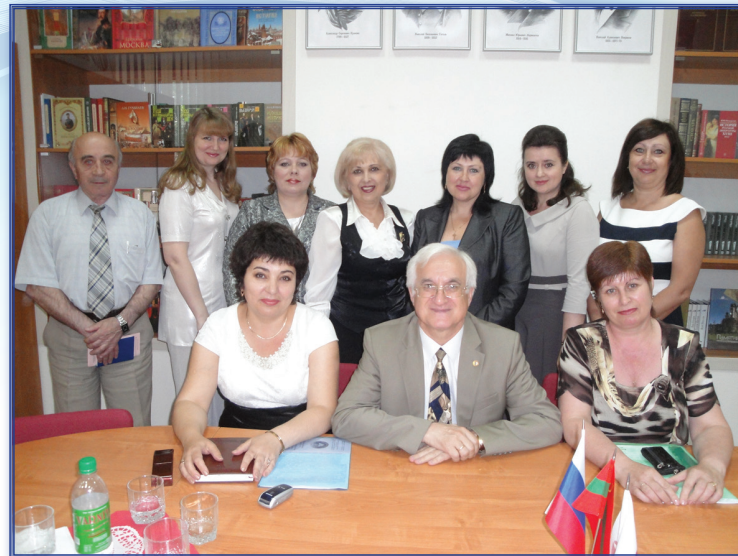
Июнь 2012 года, круглый стол в режиме интернет-связи, НИЛ «Педагогический менеджмент» и Российская академия образования, г. Москва

Традиционно каждый год проводится научно-просветительская конференция «Покровские чтения», в которой факультет принимает активное участие в качестве организатора и проведения секции «Педагогика». Преподаватели являются председателями и членами жюри в республиканском научно-исследовательском обществе