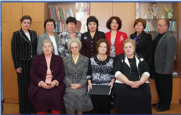
Заседание кафедры, посвященное ее 25-летию, октябрь 2008 г.

преподавания официального языка (русского) на нефилологических факультетах».