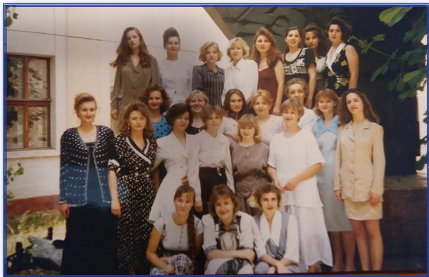
Выпуск кафедры общей и детской психологии (1996 год)