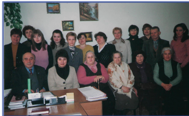
Январь 2006 года, выборы декана факультета педагогики и психологии

Показательна в этом контексте успешная деятель- ность на факультете с 2008 по 2016 годы Приднестровско- го научного центра Южного отделения Российской ака-