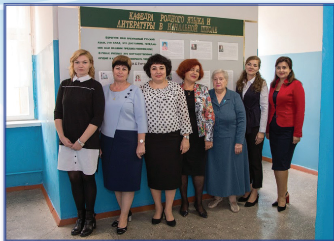
Кафедра РЯЛНШ, сентябрь 2019 г.