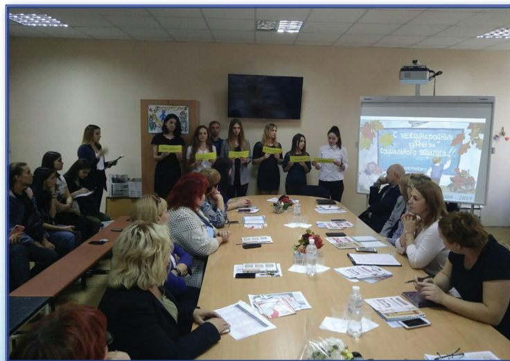
Открытое заседание студенческого научного кружка «Социальный педагог», посвященное Международному дню социального педагога

С 2012 г. осуществляется подготовка бакалавра по профессионально-образовательной программе, направление подготовки 050400 Психолого-педагогическое образование, профиль «Социальная педагогика».