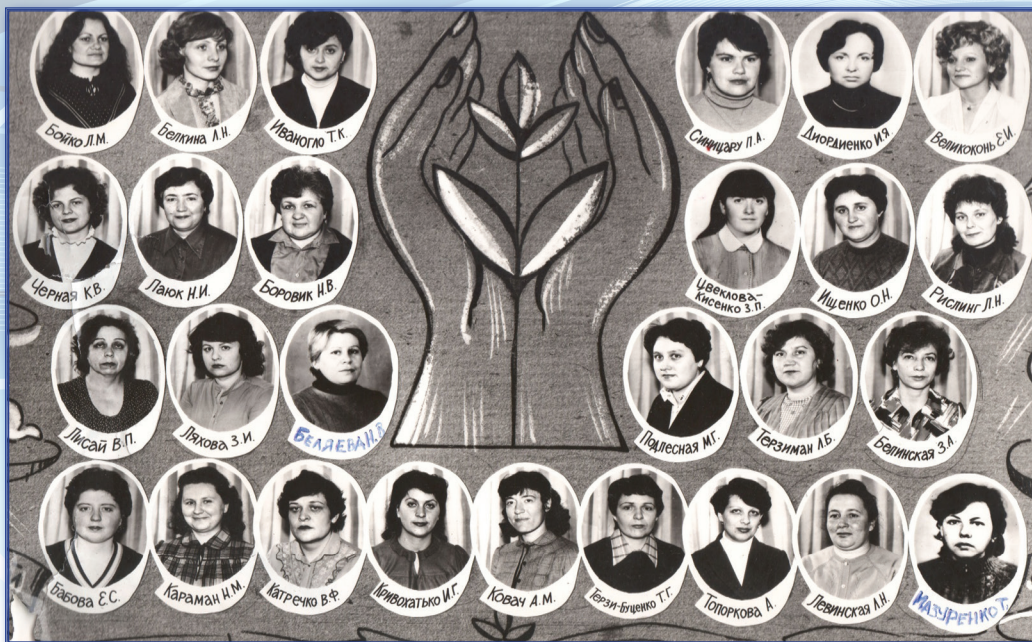
Выпуск студентов заочного отделения, 53 группы, специальности «Педагогика и психология (дошкольная)». 1984 г.