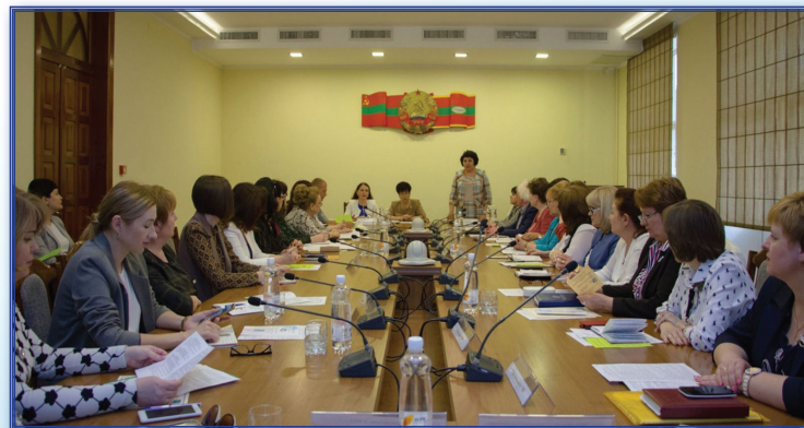
Участники Республиканского круглого стола, организованного кафедрой ДСОиПМ, «Многоуровневое высшее образование – позиция работодателя», посвященного 40-летию факультета педагогики и психологии

Времена меняются, корректируются цели и задачи подготовки педагогов для системы дошкольного и специального (коррекционного образования), возрастает роль