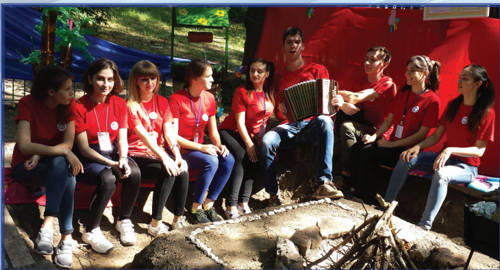
Кицканский лес, фестиваль «Приднестровская весна 2018»