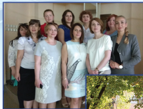
Педагогический коллектив кафедры педагогики и современных образовательных технологий

Среди кафедр факультета есть ровесница университета, – основанная в 1930 году кафедра общей педагогики. На протяжении десятилетий преподаватели кафе-