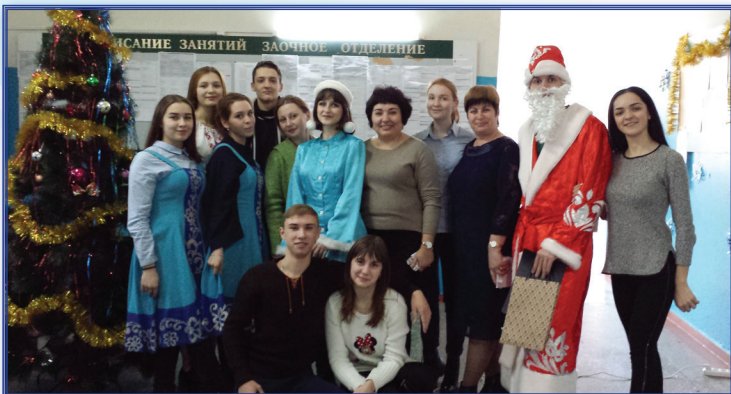
Празднование Нового 2018 года

– психолого-педагогическая поддержка, грамотное и системное оказание помощи студенту в освоении им жизненно необходимых взглядов и навыков;