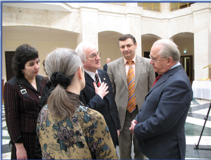
Юбилей ректора МГУ им. М.В. Ломоносова В.А. Садовниченко в Фундаментальной библиотеке МГУ, 2009 г.

Традиционно каждый год проводится научно-просветительская конференция «Покровские чтения», в которой факультет принимает активное участие в качестве организатора и проведения секции «Педагогика». Преподаватели являются председателями и членами жюри в республиканском научно-исследовательском обществе