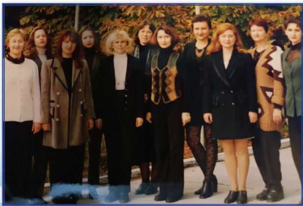
Сотрудники кафедры общей и детской психологии (1997 год)