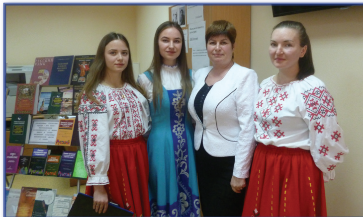
Международный день родного языка, 2017 г.

Руководством факультета ведется учет и анализ нарушений внутренней дисциплины и общественного порядка: за последние 5 лет случаев правонарушений не выявлено. В целях профилактики правонарушений на факультете проводится разъяснительная работа как сила-