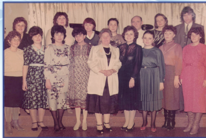
Состав кафедры 1988 г.