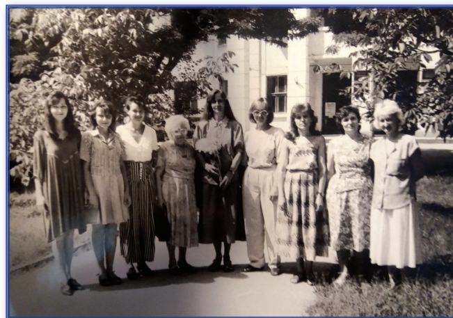
Сотрудники кафедры общей и детской психологии (1993–1994 гг.)