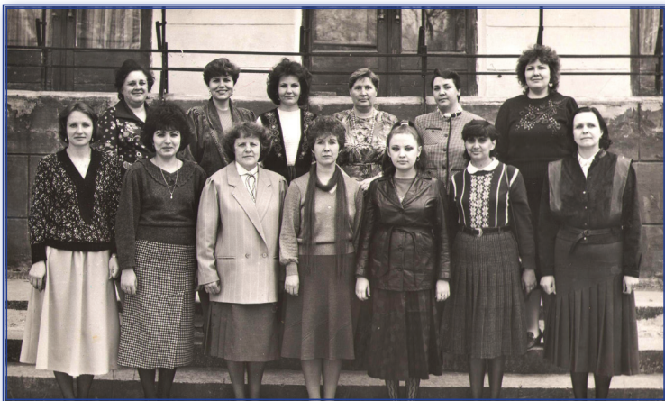
Состав кафедры 1990 г.