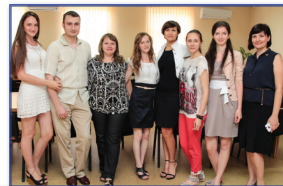
Выпуск кафедры психологии 2014 года