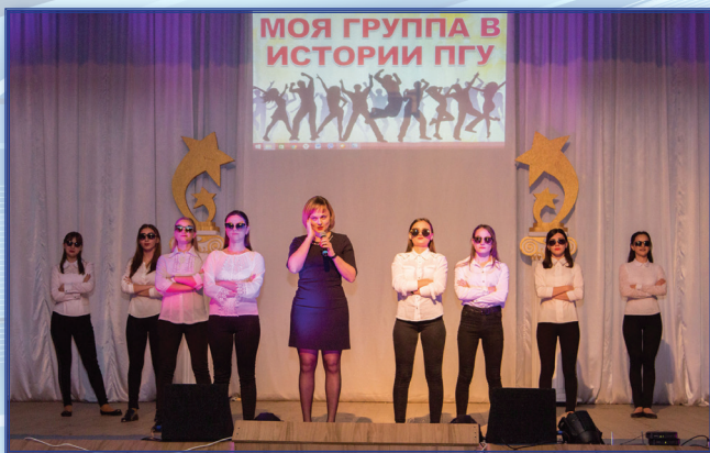
Конкурс «Моя группа в истории ПГУ»