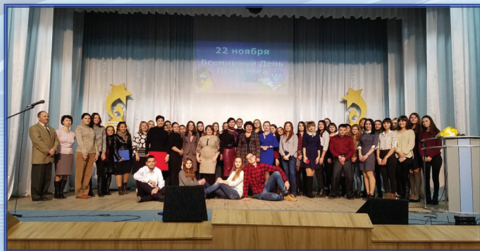
Празднование профессионального дня психолога (22 ноября 2018 года)