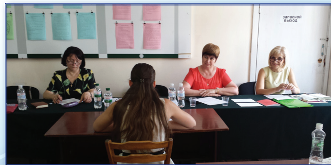
Заседание Государственной аттестационной комиссии, профиль «Начальное образование». 2018 г.

подготовке кадров высшей педагогической квалификации, оказания методической помощи преподавателям кафедры в научно-методической и научно-исследовательской работе, обеспечения условий для организации совместной с преподавателем самостоятельной работы студентов по изучению учебных курсов, закрепленных за выпускающей кафедрой. В центре представлена педагогическая литература последних лет, сборники по результатам научно-практических конференций, статистические материалы развития системы дошкольного образования по регионам республики; нормативно-правовая документация, регламентирующая деятельность ОДО Приднестровья; стенды, отражающие направления развития дошкольного образования в республике.