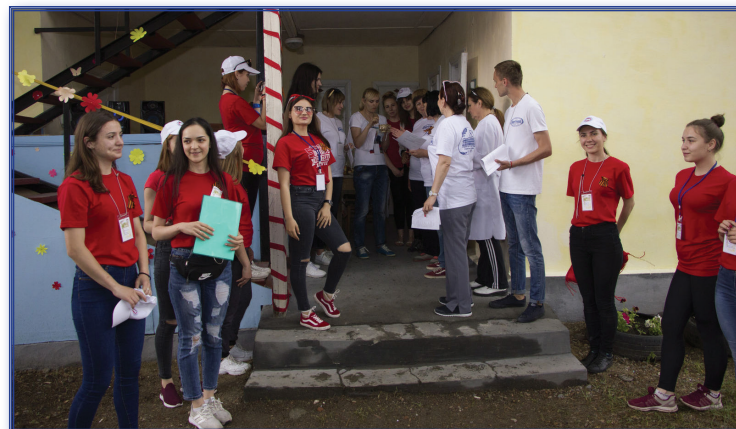
Студенческий лагерь «Приднестровская весна 2019»

в студенты; по итогам учебного года проводится «Последний звонок», на котором отмечаются лучшие студенты (объявляется благодарность, награждаются грамотами); организовываются Дни кафедр; профессиональные праздники, праздники национальных культур (русской, молдавской, украинской), международный день родного языка, литературная гостиная и др. Коллектив факультета проводит большой объем работы по укреплению традиций и укреплению престижа факультета, его направлений и профилей.