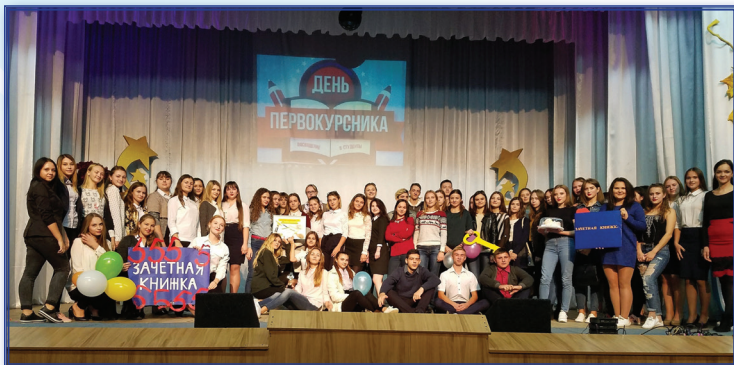
Посвящение в студенты, 2018 г.

ствия со студентами. При анализе и оценке результатов воспитательной деятельности основной акцент делается на внутренних изменениях личности студента, на его психологическом благополучии и создании условий для этого благополучия, комфорта. В этом контексте отметим, что если студент совершил правонарушение, то его участие в том или ином конкурсе, спортивном соревновании и т. п. не совсем может квалифицироваться как достижение.