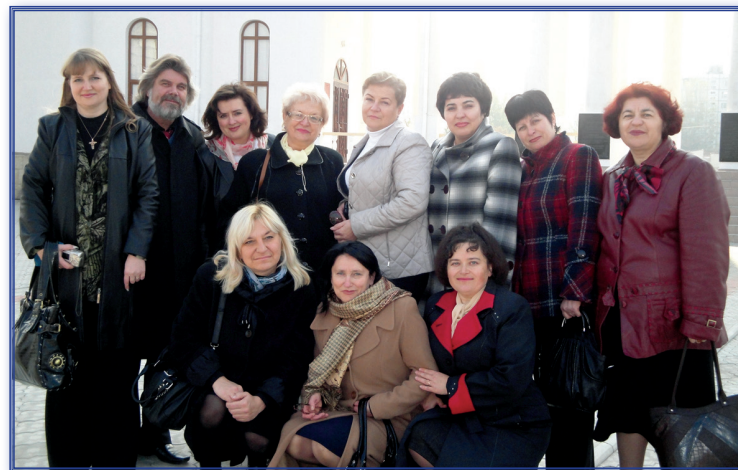
Участники международной конференции «Подготовка компетентного специалиста: теория и практика», 20-21 октября 2011 г. (г.Тирасполь, Москва, Калуга, Могилев)

Сформировалась традиция ежегодного проведения методологических семинаров с начинающими исследователями. Все молодые преподаватели нацелены на получение ученой степени кандидата наук, поэтому являются аспирантами и соискателями. Ежегодно на факультете