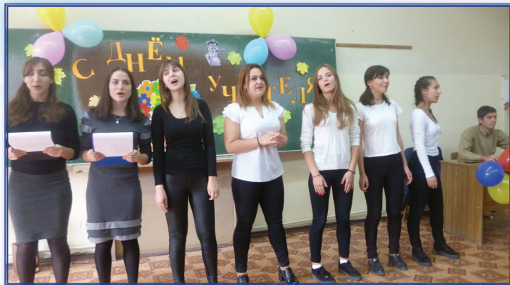
Поздравление с Днем учителя