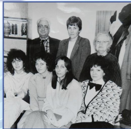
Сотрудники кафедры общей и детской психологии (1991–1992 гг.)